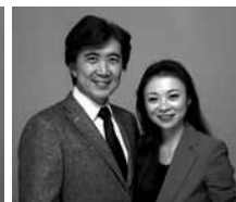
左/自宅で瞑想中。上/ラディアンス代表の山崎夫妻。磁石の様に惹き付ける技法で 51 才の時に 21 才年下の妻を惹き付け結婚。夫婦喧嘩無しのおしどり夫婦